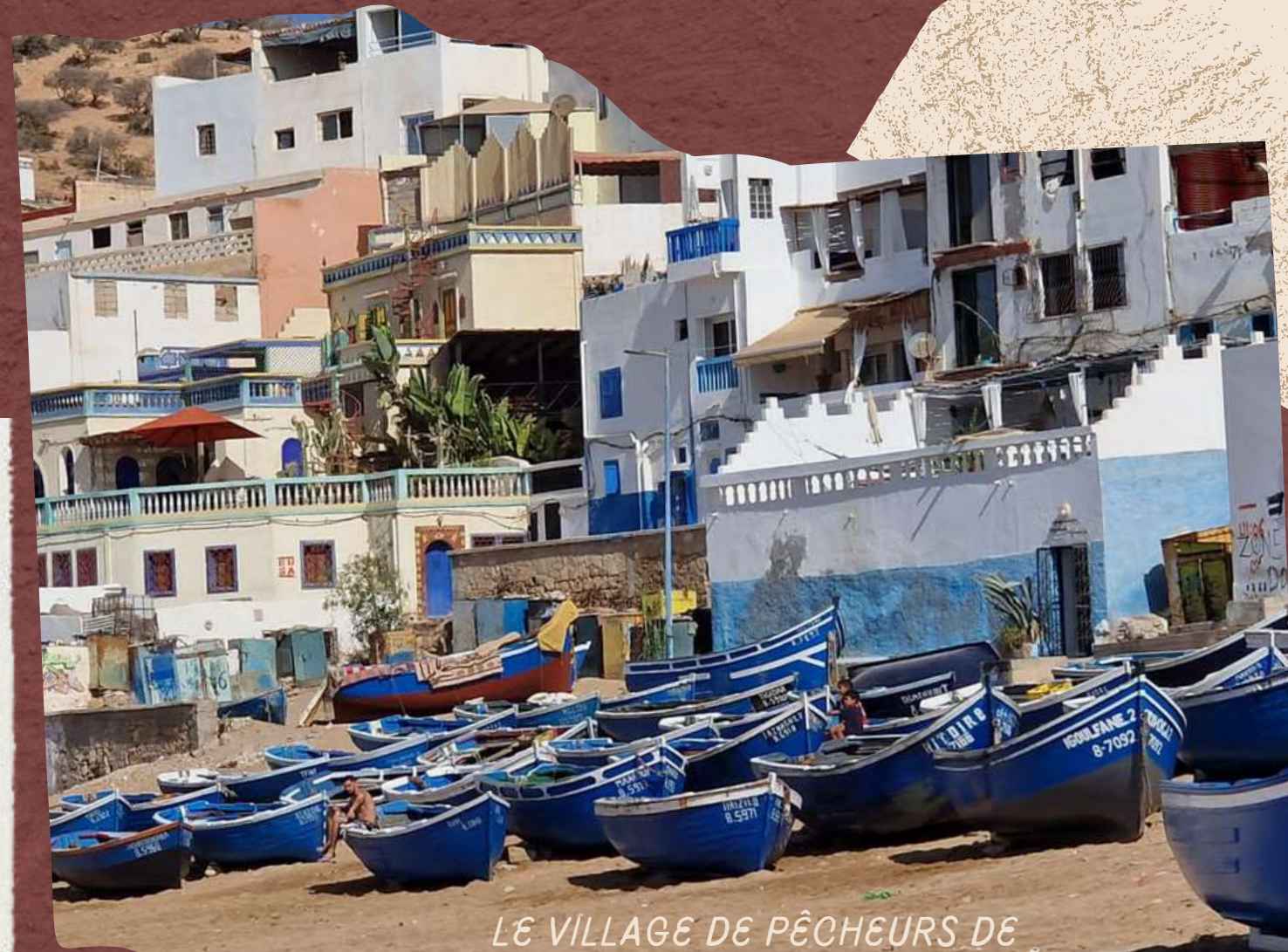
LE VILLAGE DE PÊCHEURS DE TAGHAZHOUT